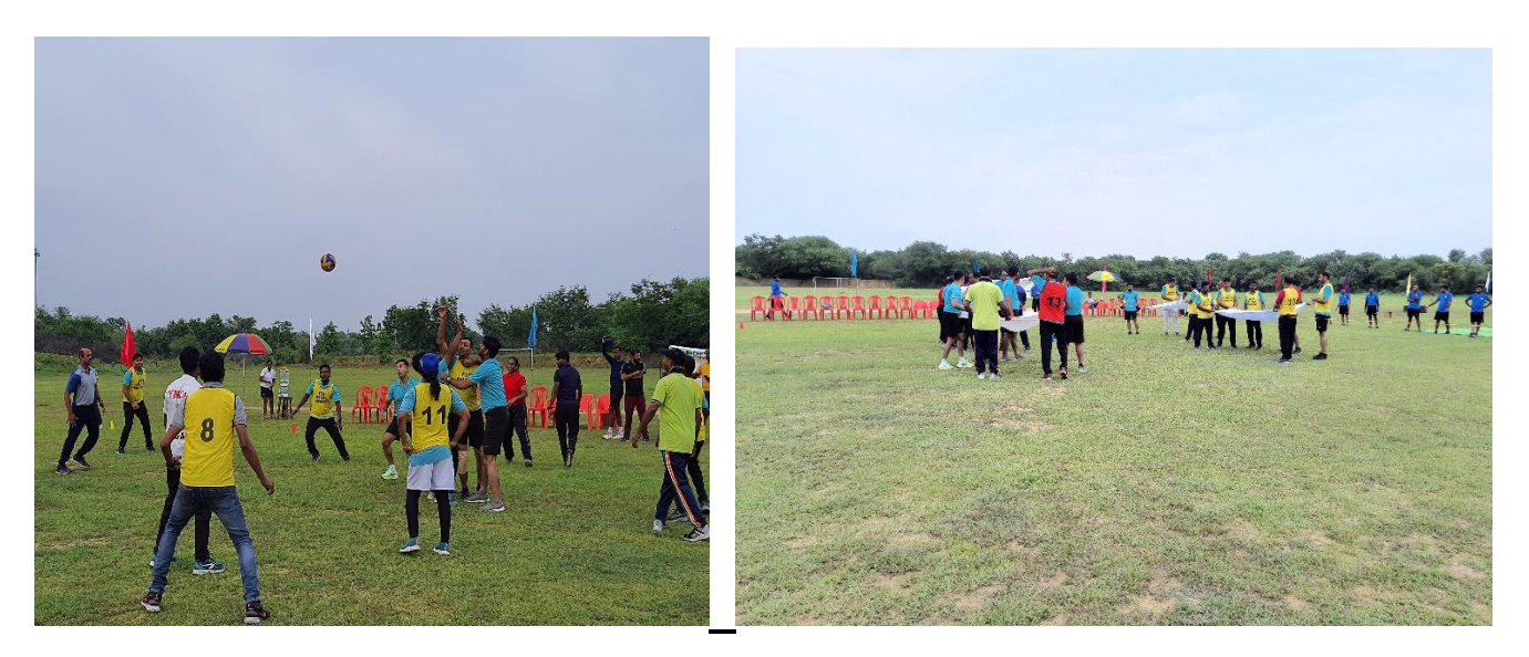
FDP Participants Enjoying with Minor Games Sessions taken by- Dr. M.S. Dhapola