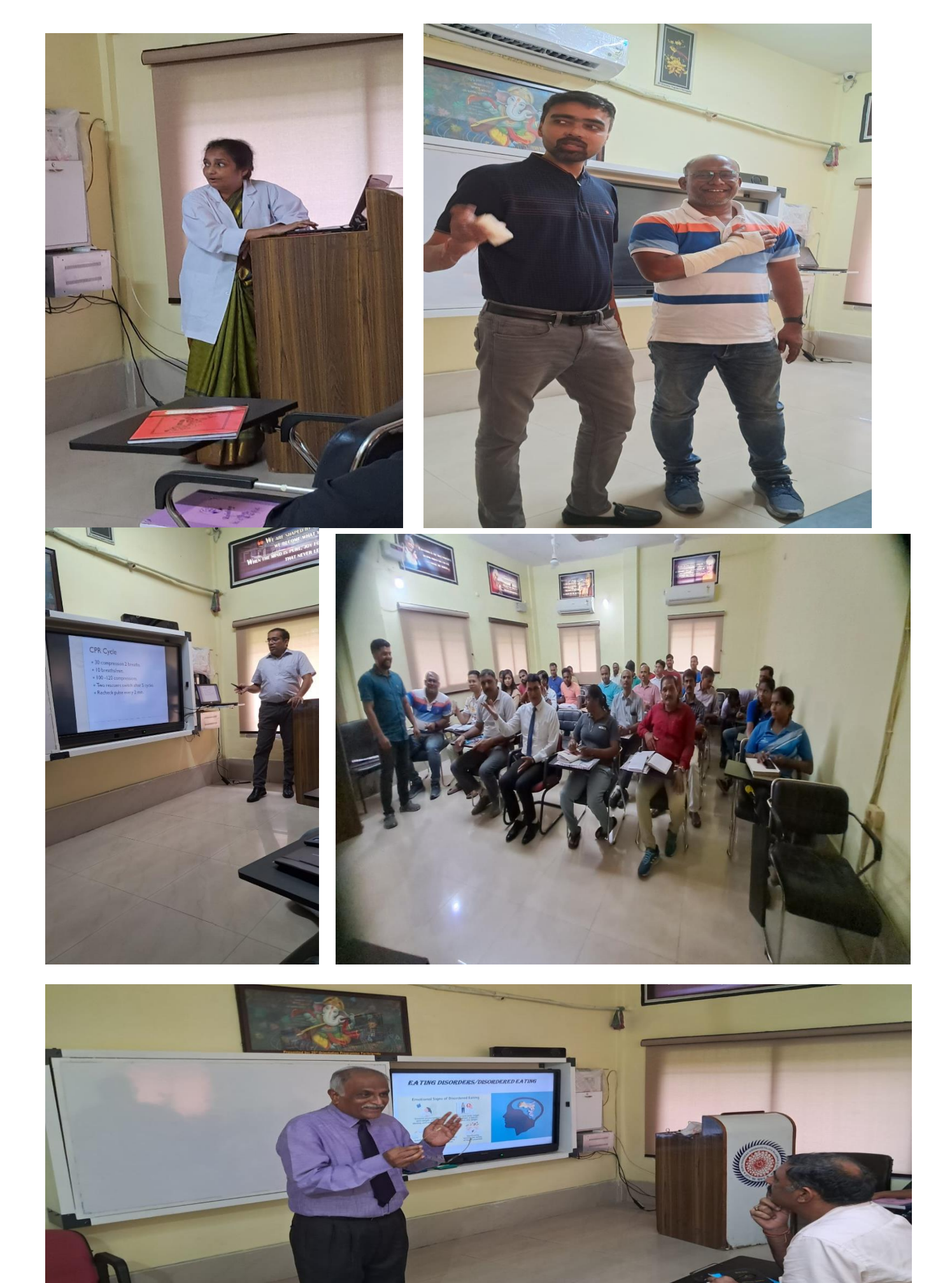
Informative and Interactive session of FDP by Eminent Experts from all Over the Country