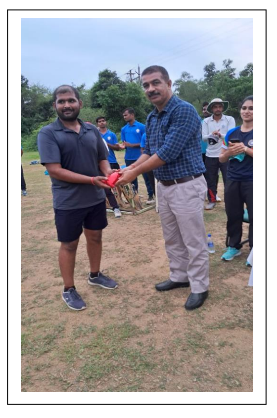
Prize Distribution by Dean SoS-Education

Prize Distribution to the Winners & Runners up team's captains of Minor Games