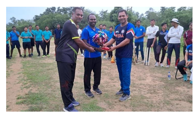
Prize Distribution by Head (Physical Education)