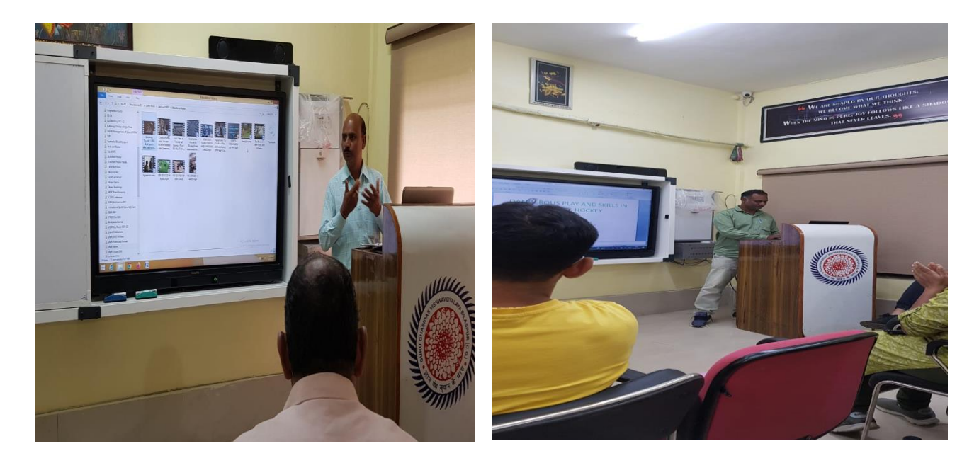
Presentation of Assignments by FDP Participants During the FDP