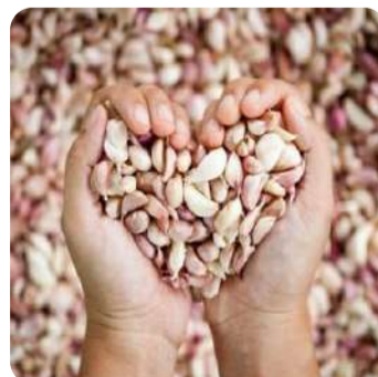
6 दिनों में ही