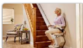
The Cost of Stair Lifts May Surprise You