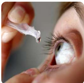
आंखों की रोशनी बढ़ाने