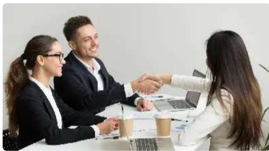
It May Be Easier For Indians to Find Jobs Outside India Than You Think