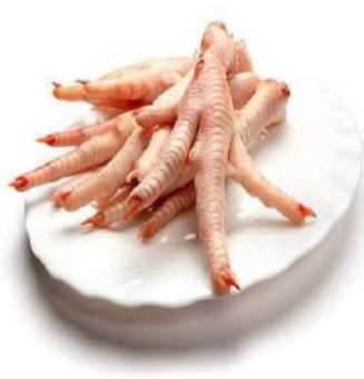
क्या आप जोड़ों के दर्द से