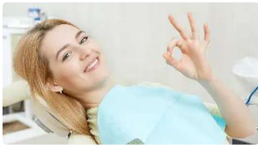
Dental Implants Cost Outside India Might Surprise You