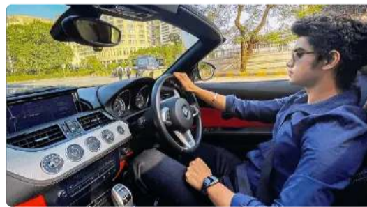
२६ वर्षीय नौजवान ने करोड़ों रुपये कमाए, इस तरकीब को धन्यवाद!