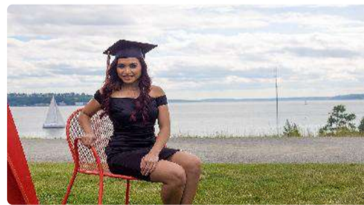
MBA cost in Australia for Indians Student Might Surprise You