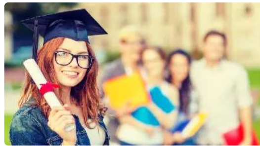
The Cost of MBA Degrees Outside India for Indian Students Might Surprise You