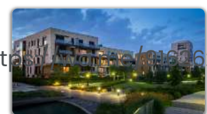
Outside India Apart Might Surprise You

(https://www.izooto.com/2018/10/17/text=hi)