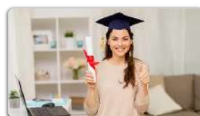
The Cost of MBA Degree Outside India Might Surprise You