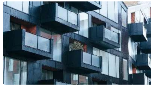
The Cost of a Luxury Apartments Might be Surprise You